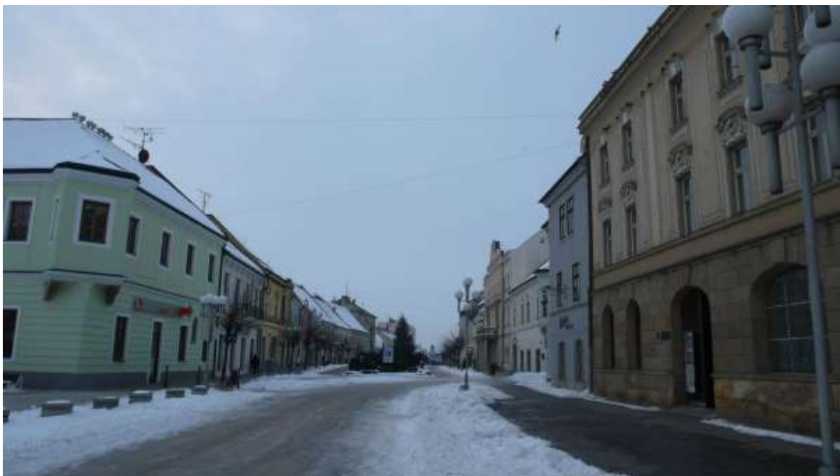
2 - HL - pohľad od Trojičného námestia južným smerom na vežičku objektu Námestia SNP (ochranné pásmo mestskej pamiatkovej rezervácie)