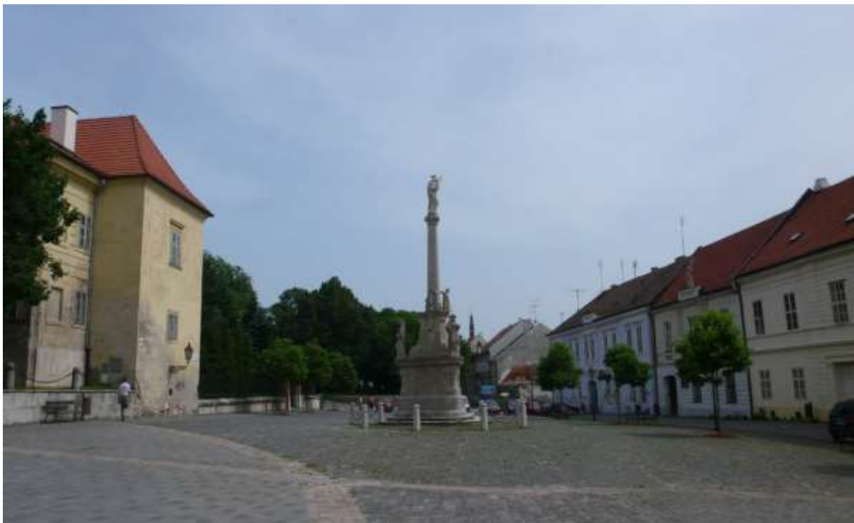
2 - NSM - priehľad námestím od fary južným smerom na historické dominanty - vežu Klariského kostola a súsošie sv. Jozefa