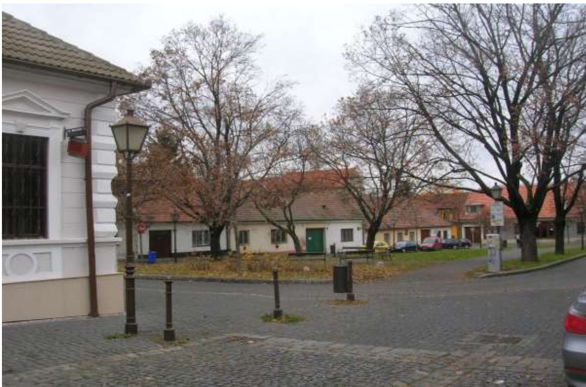
3 - JE - priehľad ulicou s parkom - severozápadným smerom v priehľade dominanty objektov Univerzitných budov