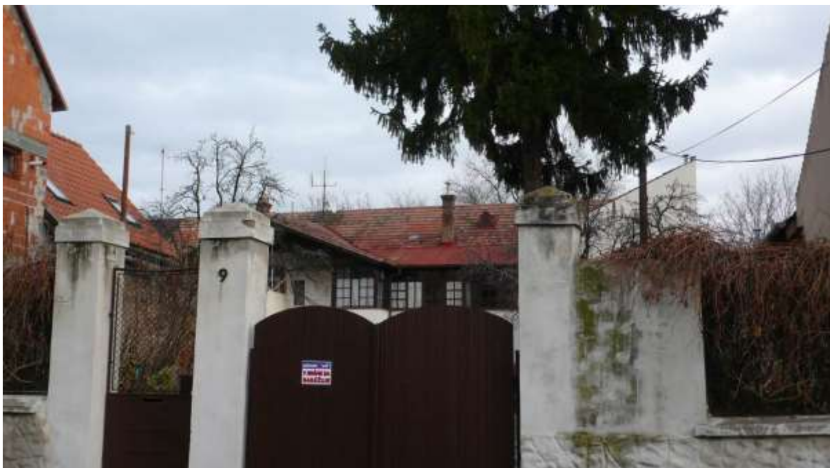
3 - KA - pohľad východným smerom na historizujúci objekt, situovaný v línii mestského opevnenia, s ojedinelou rezbárskou výzdobou