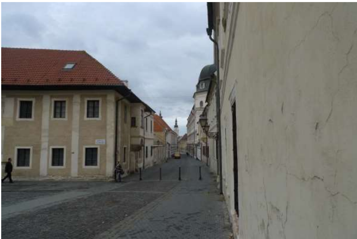
2 - ST - priehľad západných smerom na historické dominanty – mestskú vežu a vežu kostola sv. Anny