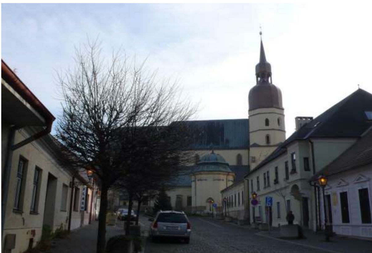
2 - JE - priehľad južným smerom na historické výškové dominanty veže farského kostola sv. Mikuláša