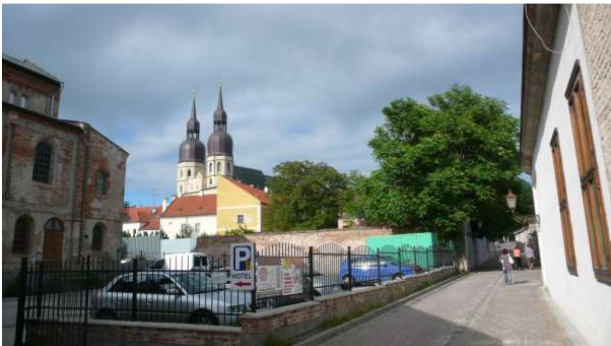
3 - HAU - priehľad severným smerom na synagógu a farský kostol sv. Mikuláša