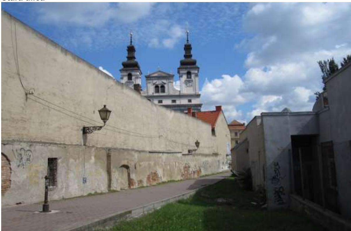
1 - STA - (novovytvorená ulička) priehľad východným smerom na historickú dominantu Univerzitného kostola