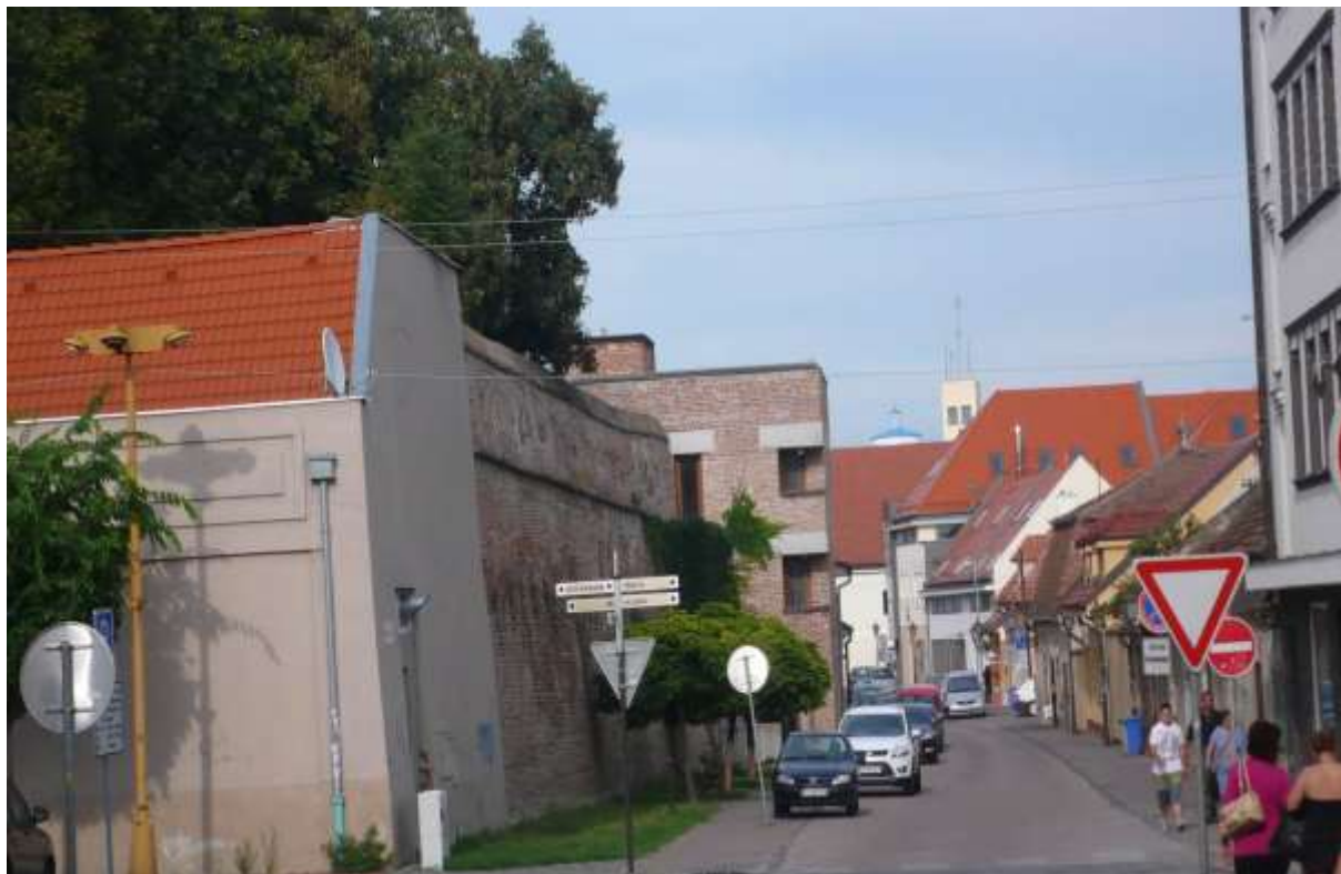
1 - HB - pohľad od Štefánikovej ulice východným smerom na vonkajšiu dominantu vodárenskej veže