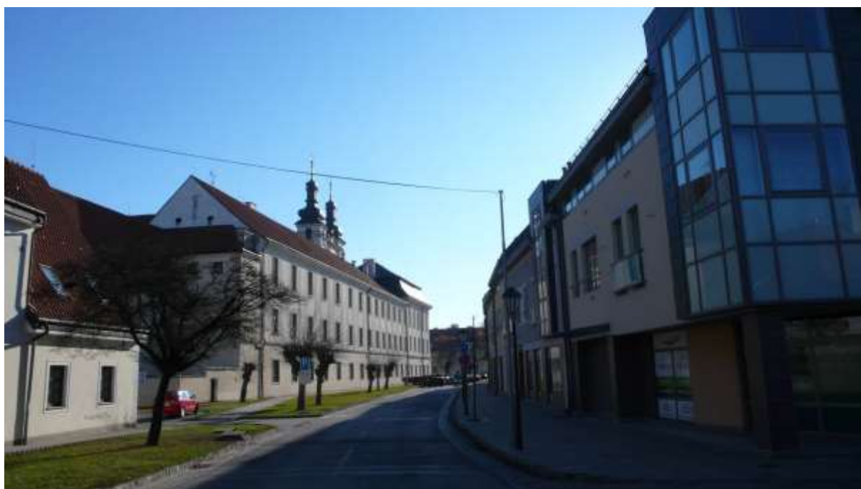
1 - HP - pohľad južným smerom na historické dominanty univerzitných budov a Univerzitného kostola sv. Jána Krstiteľa