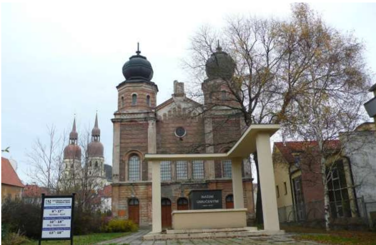
2 - HA - pohľad východným smerom na historickú dominantu synagógy a Farský kostol sv. Mikuláša