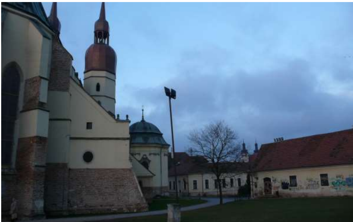
3 - NSM - priehľad od mestského opevnenia západným smerom na historické výškové dominanty veže farského kostola sv. Mikuláša a veže Univerzitného kostola