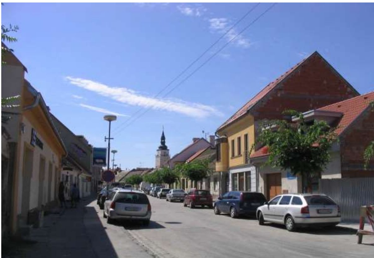
1 - PE - pohľad ulicou južným smerom na historickú dominantu mestskú vežu