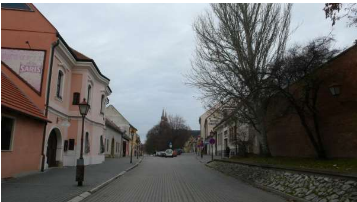
1 – KA - priehľad severným smerom na historickú dominantu Kostol sv. Mikuláša