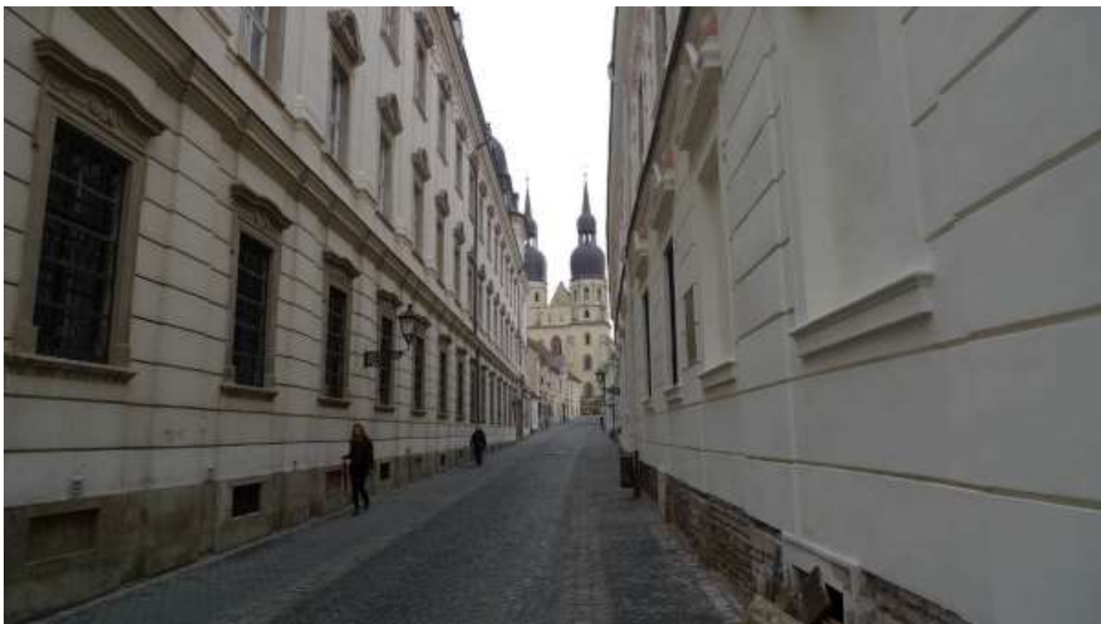
1 - ST - priehľad východným smerom na historické výškové dominanty veže farského kostola sv. Mikuláša