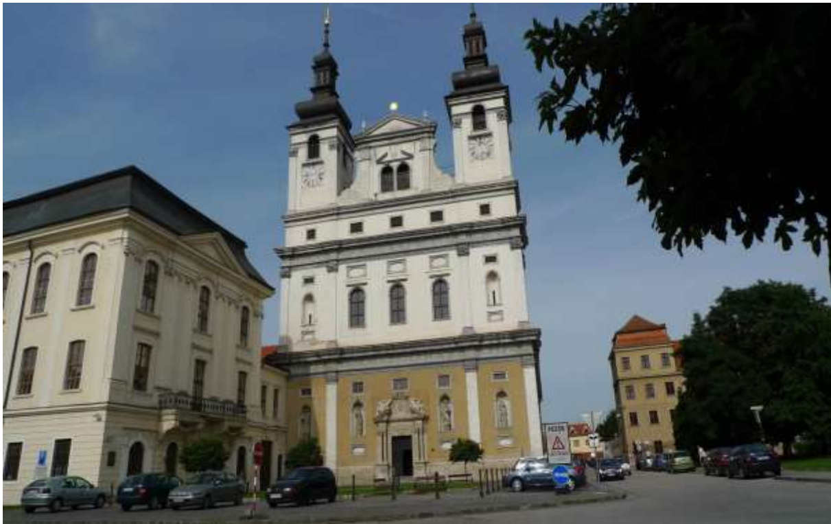
2 - UN - pohľad východným smerom na historické dominanty Univerzitných budov a Univerzitného kostola sv. Jána Krstiteľa