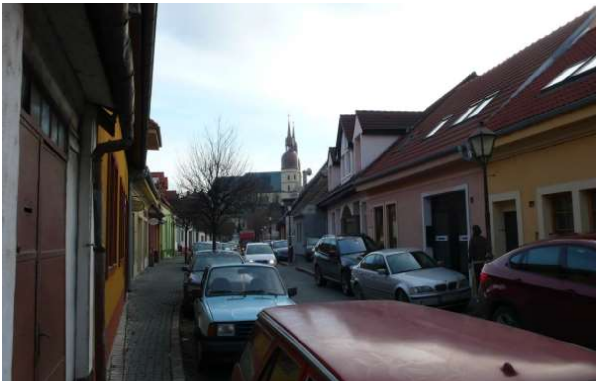
1 - JE - priehľad južným smerom na historické výškové dominanty veže farského kostola sv. Mikuláša