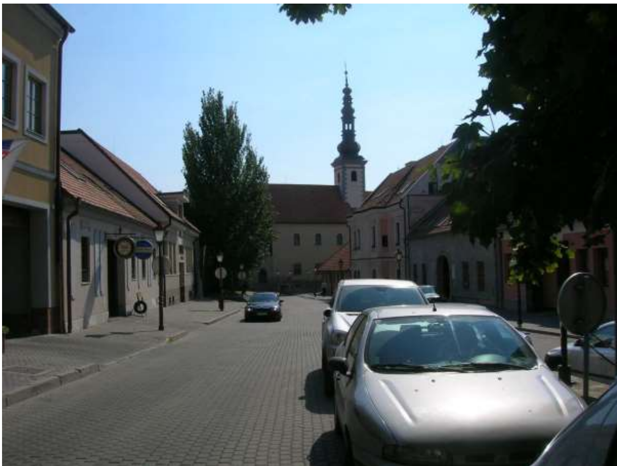
2 - KA - pohľad južným smerom od južného konca parčíka na historickú dominantu Klariského kláštora a dominantu vežu Klariského kostola