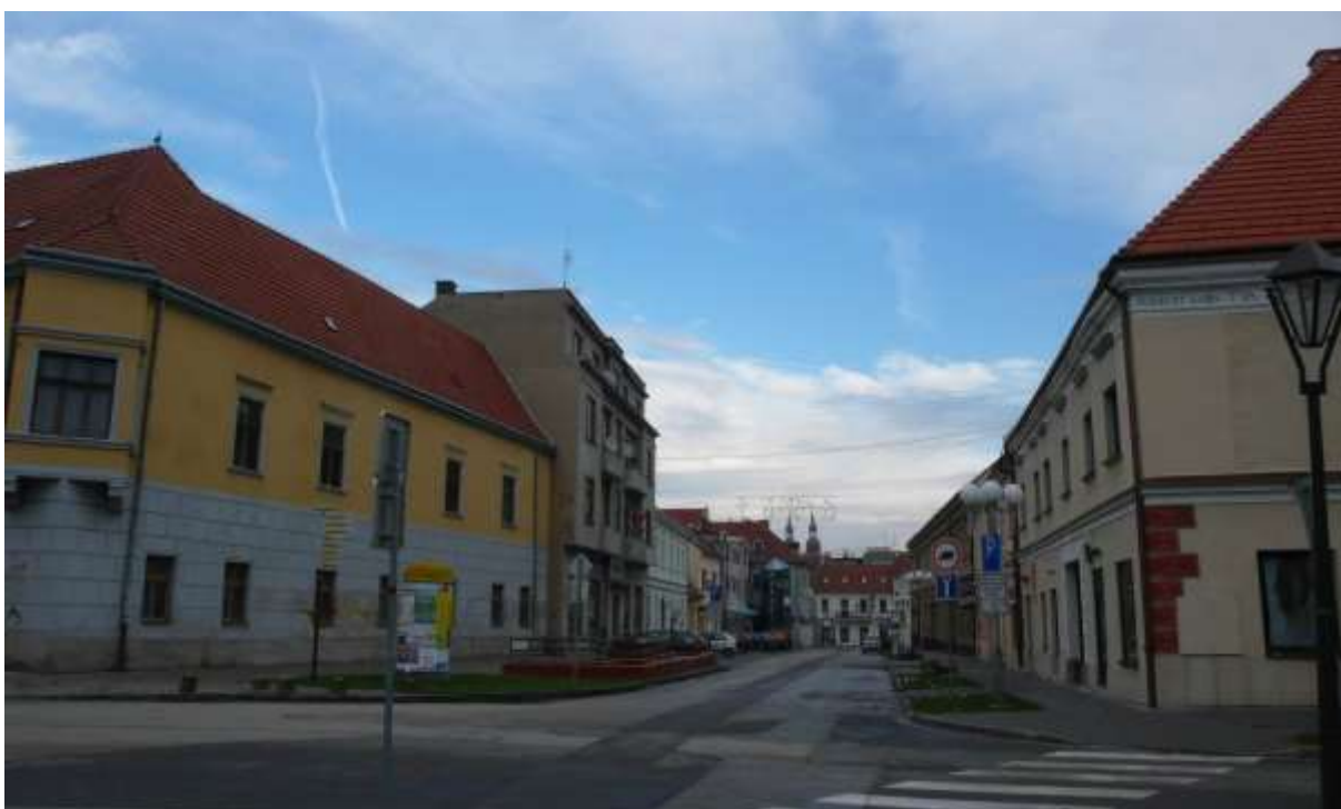
1 - RA - pohľad ulicou východným smerom na vežu Kostola sv. Mikuláša