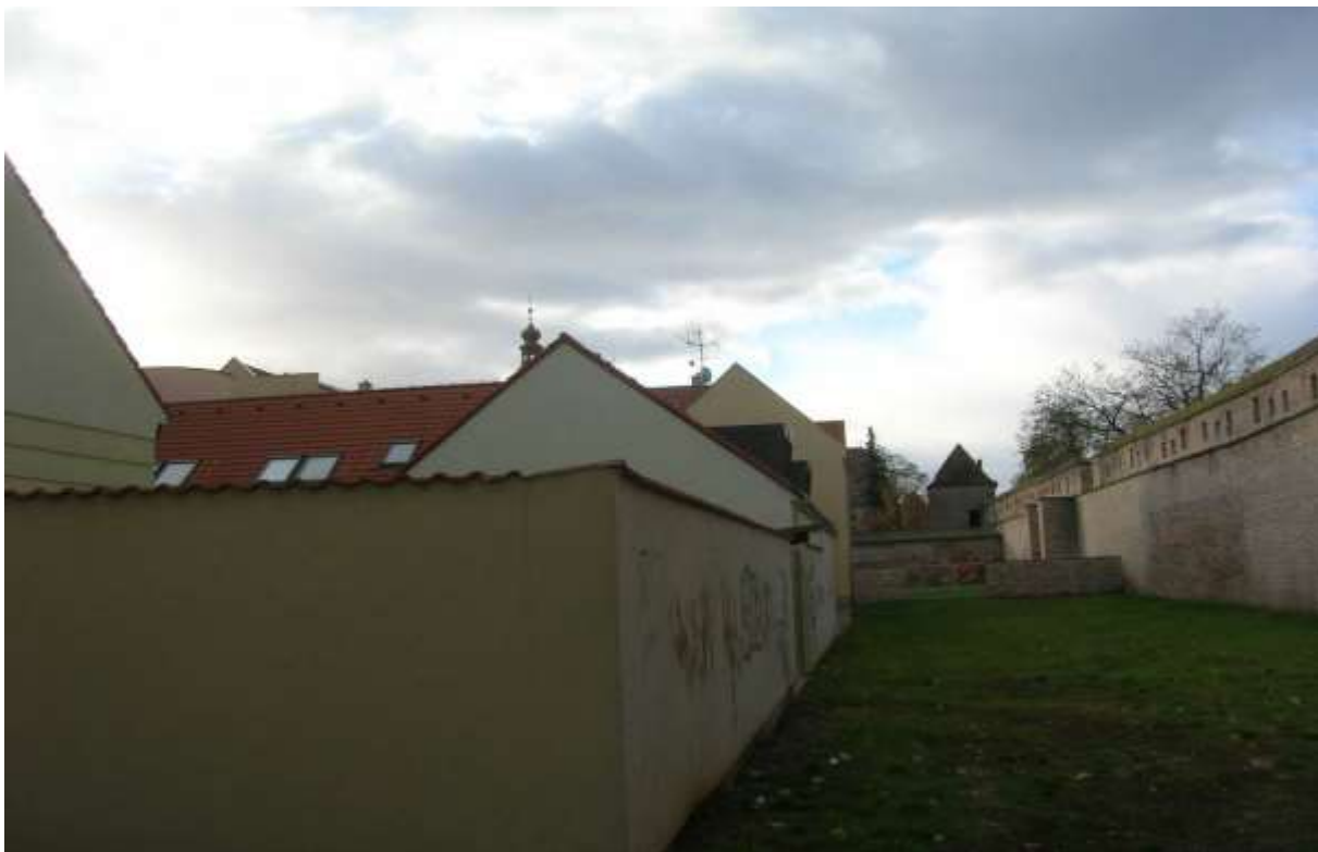
3 - FR - pohľad južným smerom na historickú dominantu Františkánskeho kláštora a dominantu vežu Františkánskeho kostola sv. Jakuba a vežu mestského opevnenia z príhradobného priestoru