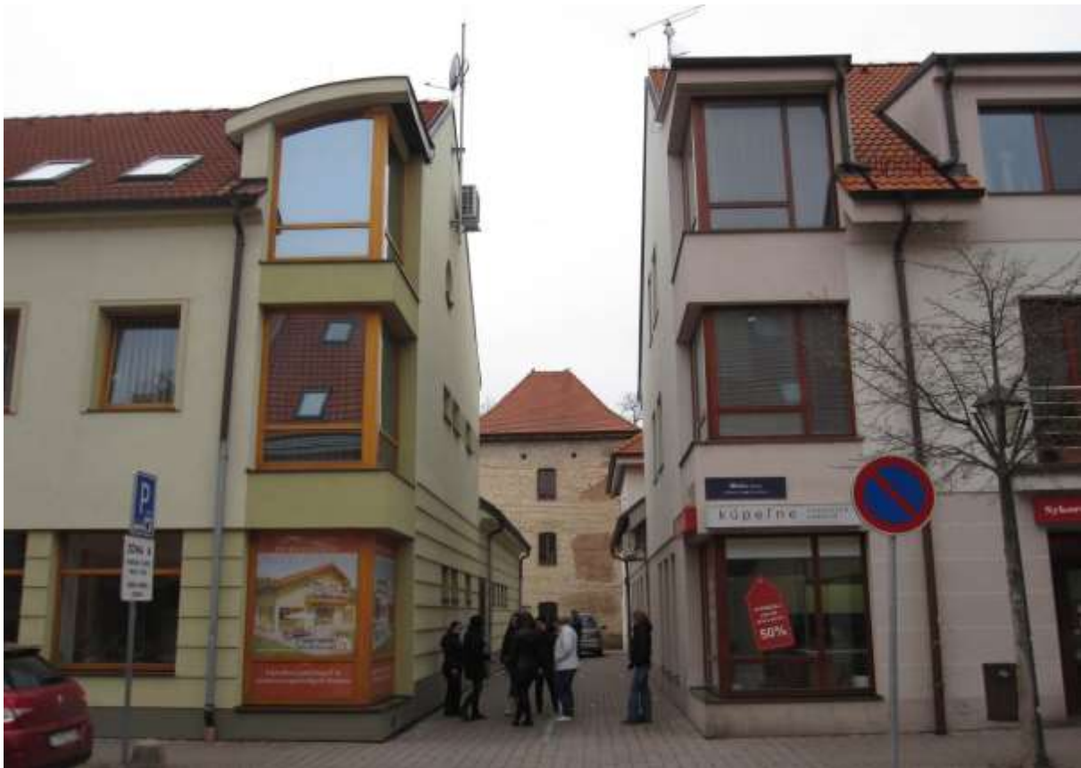
2 - FR - pohľad západným smerom na baštu mestského opevnenia