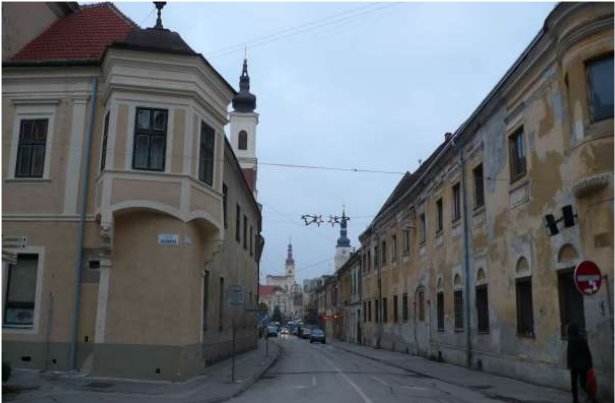
1 - HV - pohľad od Hollého ulice západným smerom na historické dominanty Mestskú vežu a na vežu Kostola sv. Anny a vežu Františkánskeho kostola a divadlo