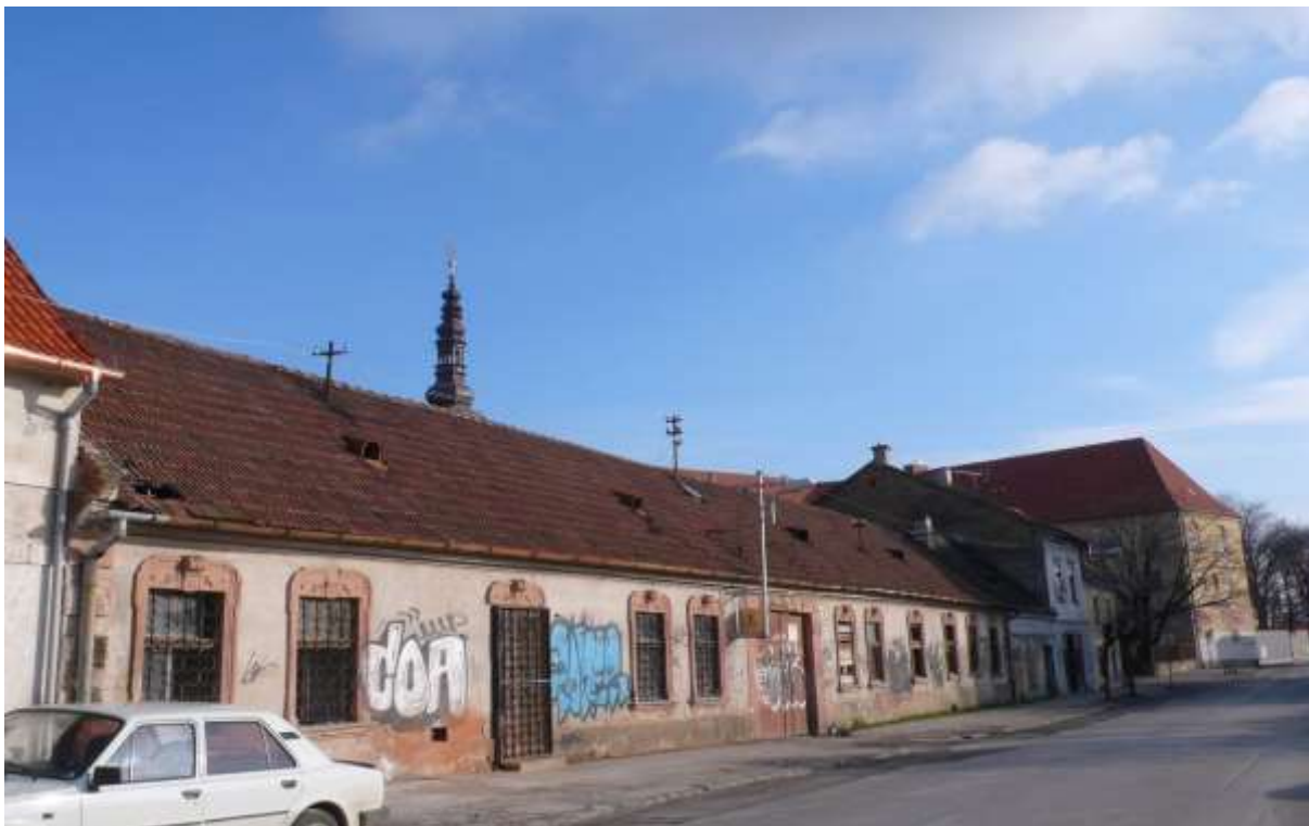
3 - HA - priehľad juhovýchodným smerom z komunikácie pri vysokej škole (MTF v Trnave) na historickú dominantu Klariského kláštora a dominantu vežu Klariského kostola