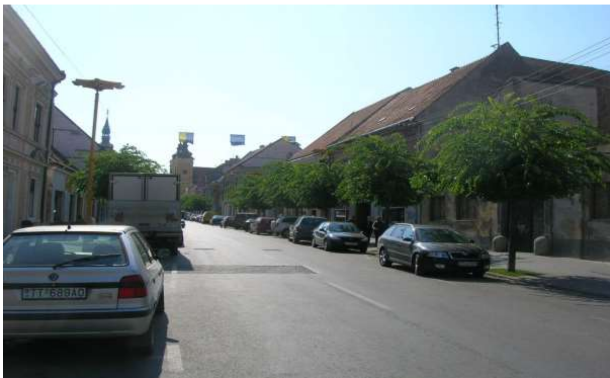
1 - ŠT - priehľad južným smerom na historickú dominantu mestskej veže a veže Jezuitského kostola