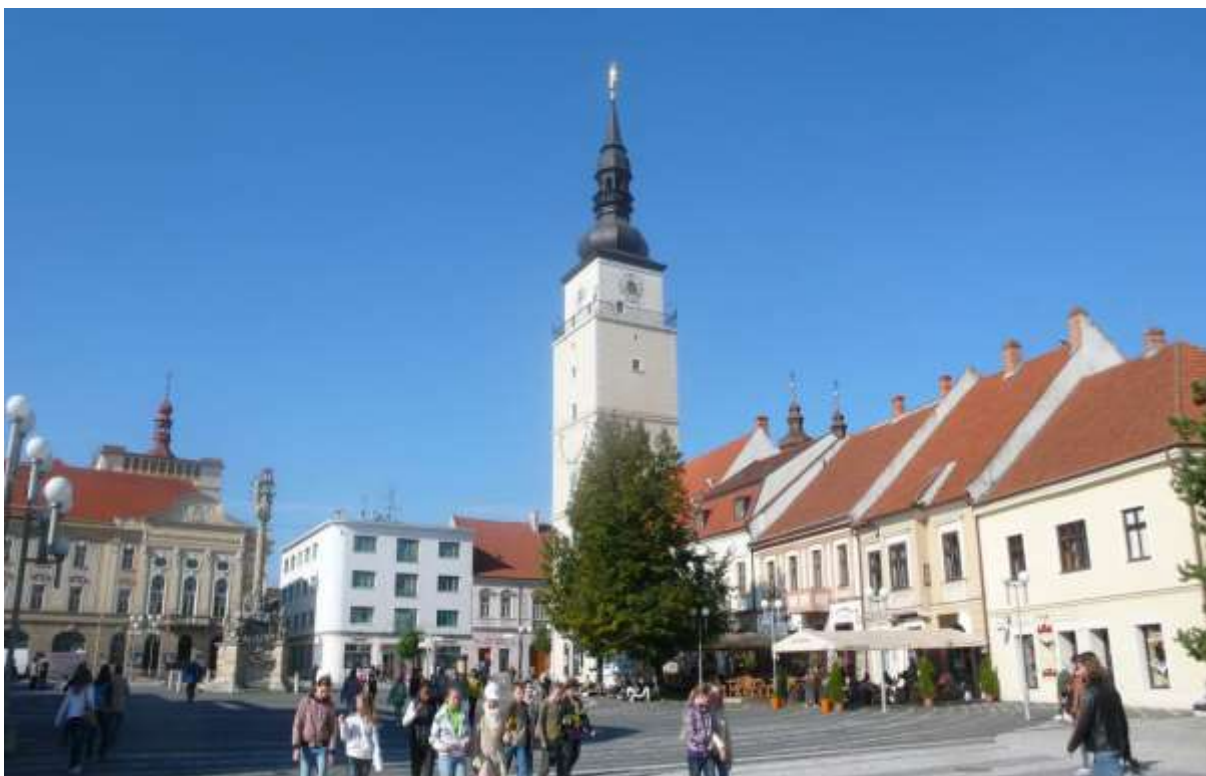
1 - TN - priehľad západným smerom do Divadelnej ulice a na historickú dominantu mestskú vežu a veže Jakubského a Jezuitského kostola