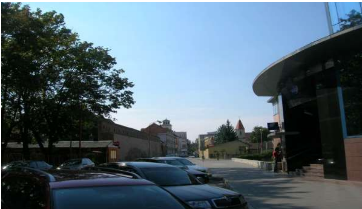
1 - DB - priehľad západným smerom na historickú dominantu vežu Evanjelického kostola a vežičky Kostola sv. Heleny a na zachovanú časť mestského opevnenia