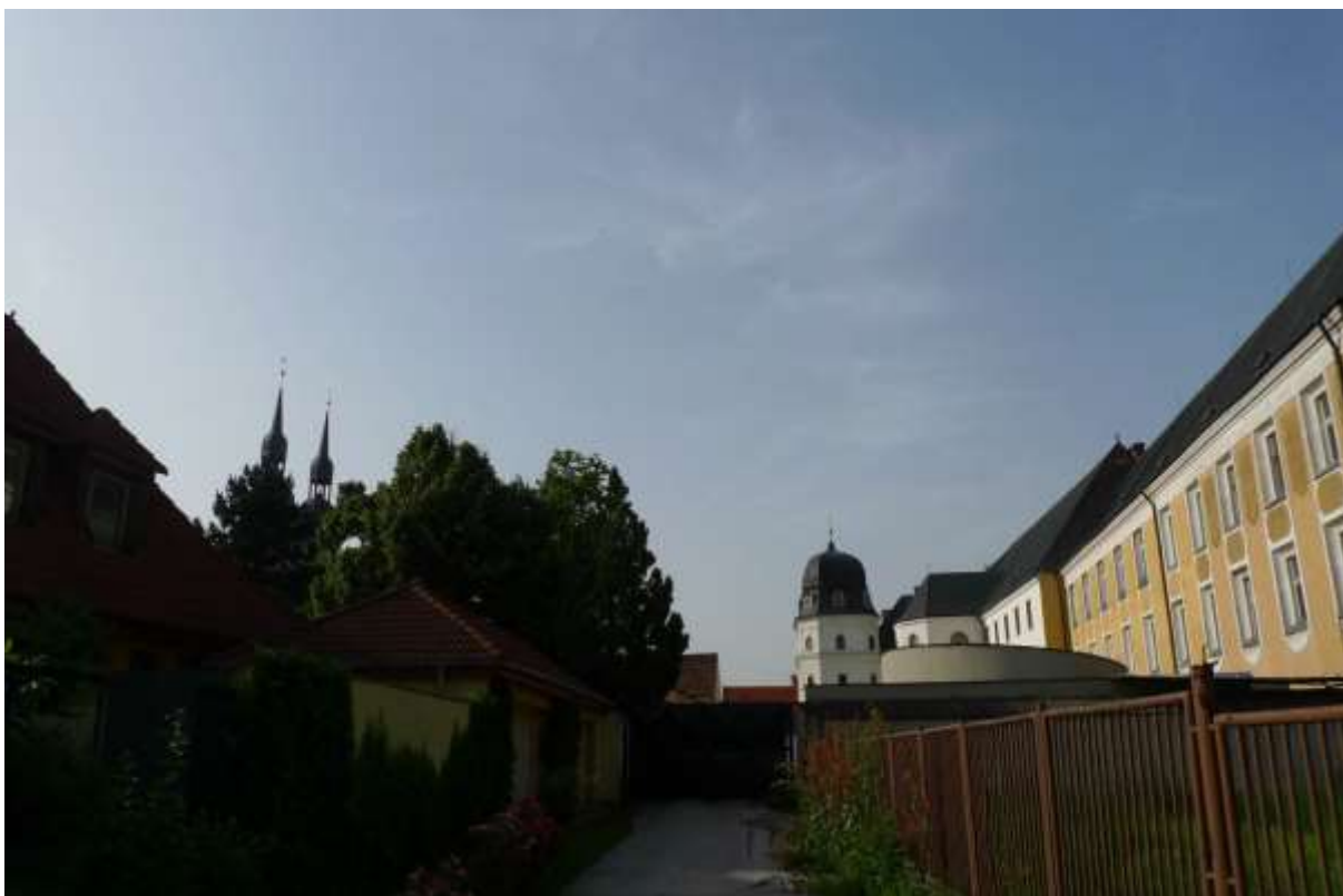
2 - IN – v mieste napojenia Jerichovej ulice pohľad na historickú dominantu Univerzitného komplexu Kaplnku sv. Jána Evanjelistu a veže Kostola sv. Mikuláša