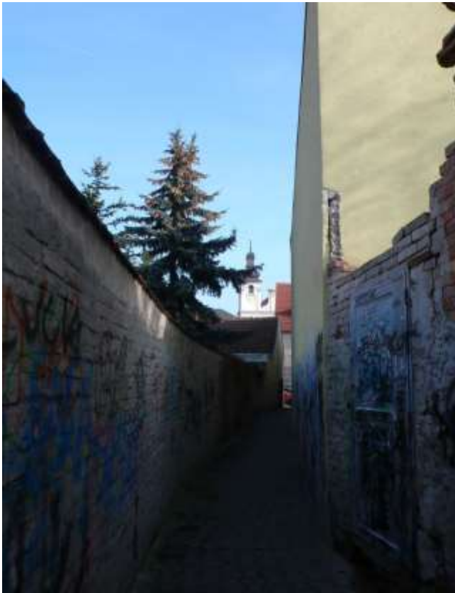
1 - TR - pohľad východným smerom na historický objekt univerzitného kostola