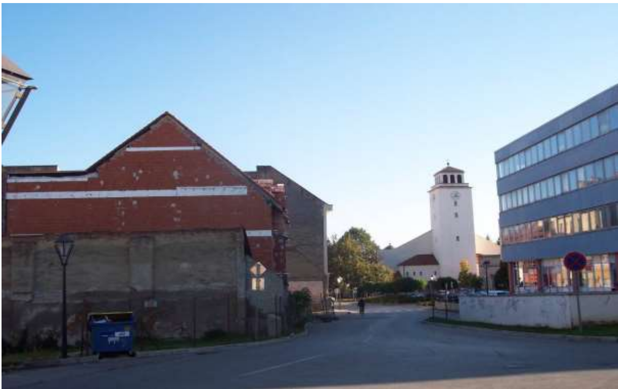
2 - VA - pohľad južným smerom na Evanjelický kostol