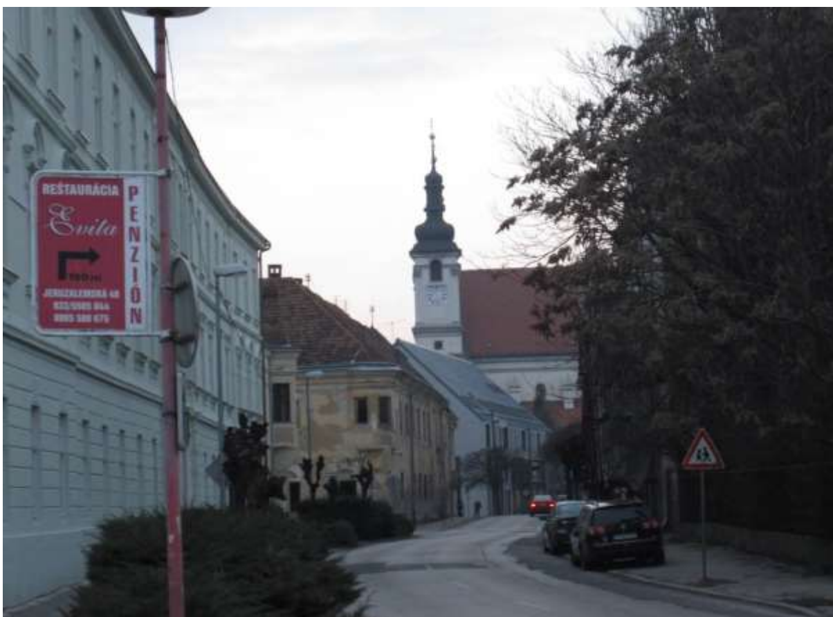
3 - HO - priehľad severným smerom od Halenárskej ulice na historickú dominantu Univerzitného kostola sv. Jána Krstiteľa a univerzitných budov