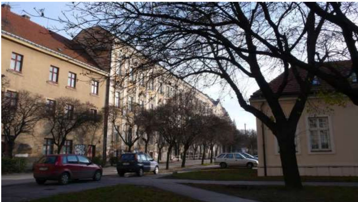
1 – HO - pohľad južným smerom na historickú dominantu univerzitných budov