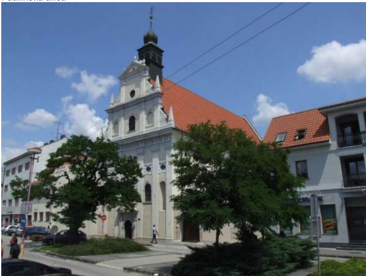
1 - PA - priehľad severným smerom na Paulínsky kostol