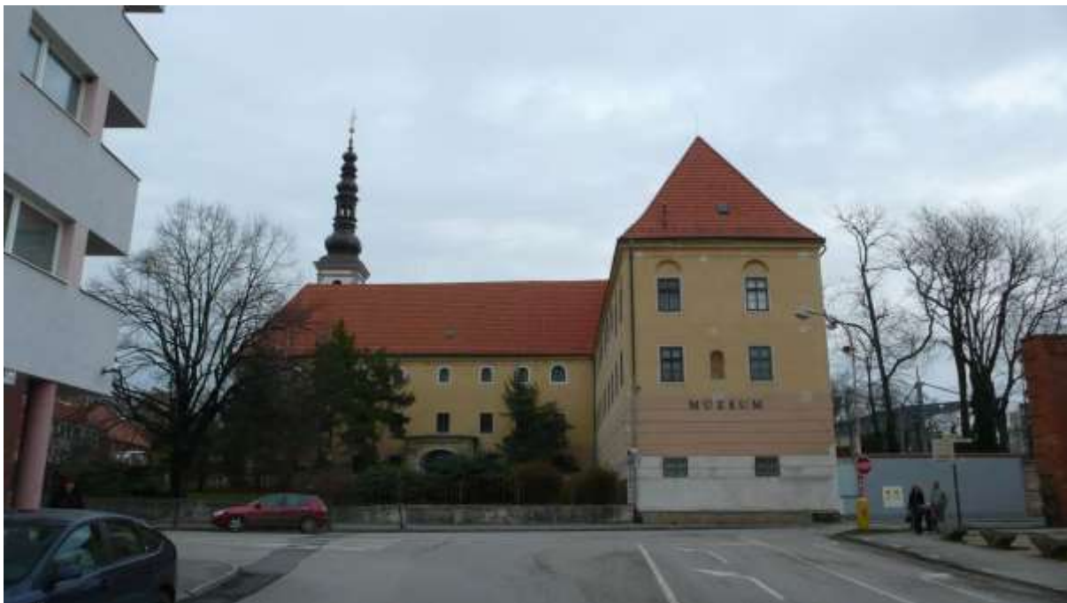
1 - MN - pohľad námestím východným smerom na Klariský kostol a kláštor