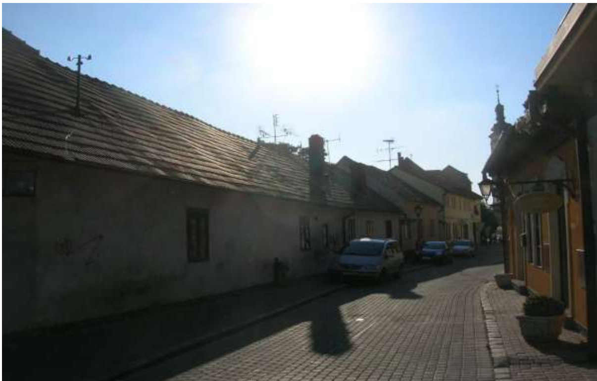
1 - IN - pohľad ulicou západným smerom na historickú dominantu Univerzitného kostola sv. Jána Krstiteľa