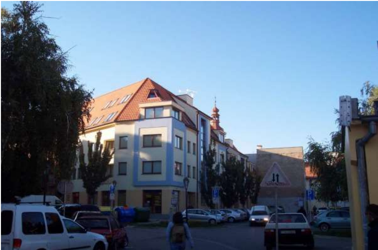
1 - VA - pohľad severným smerom na radničný areál a Františkánsky kostol