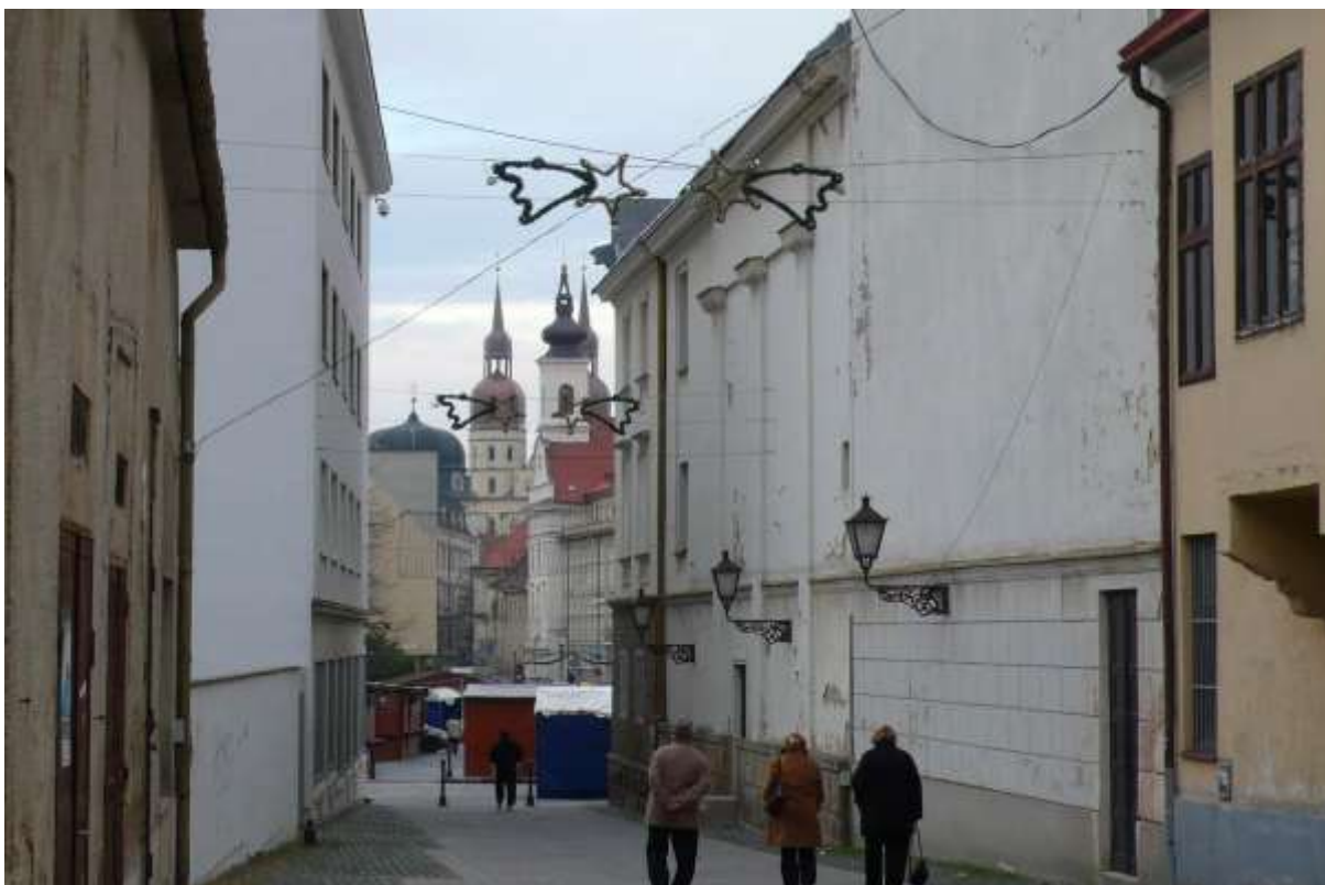
2 - DI - priehľad východným smerom na historické dominanty: kaplnku sv. Jána Evanjelistu šľachtického konviktu (dnes sídlo arcibiskupského úradu), veže kostola sv. Mikuláša, vežu kostola sv. Anny – kostol uršulínok