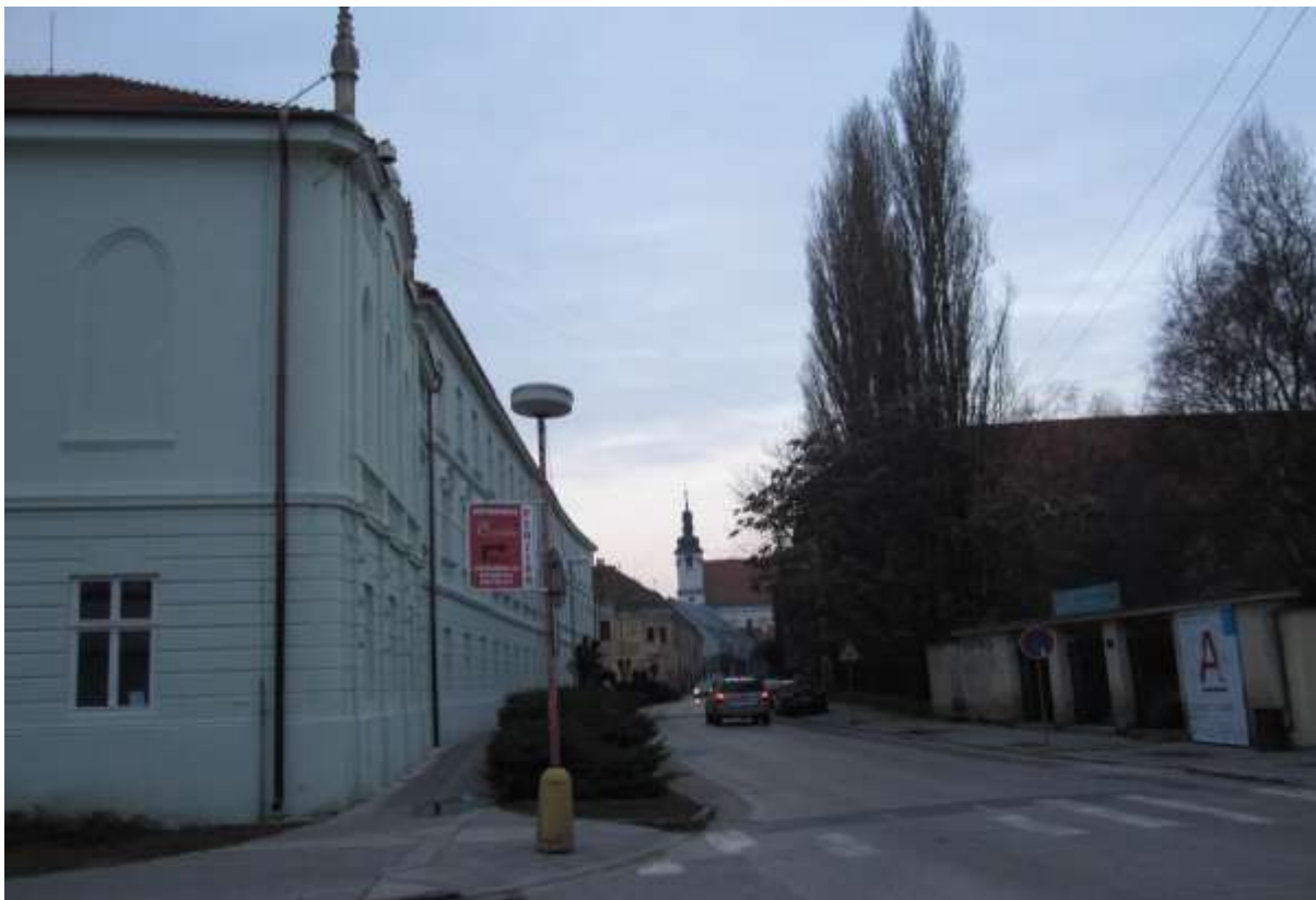
1 - HA - pohľad severným smerom z komunikácie pri Dolnopotočnej ulici na historickú dominantu Univerzitného kostola