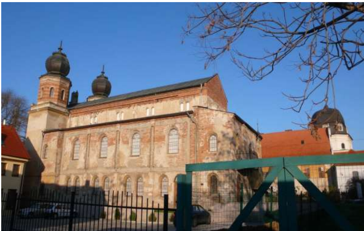
2 - HAU - priehľad severným smerom na synagógu