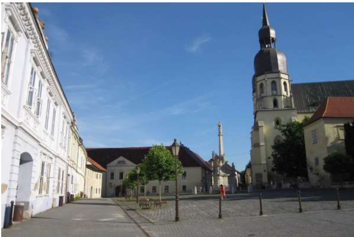
1 - NSM - priehľad z juhu námestím severovýchodným smerom na historické domunanty – kostol, arcibiskupský palác, faru a súsošie sv. Jozefa