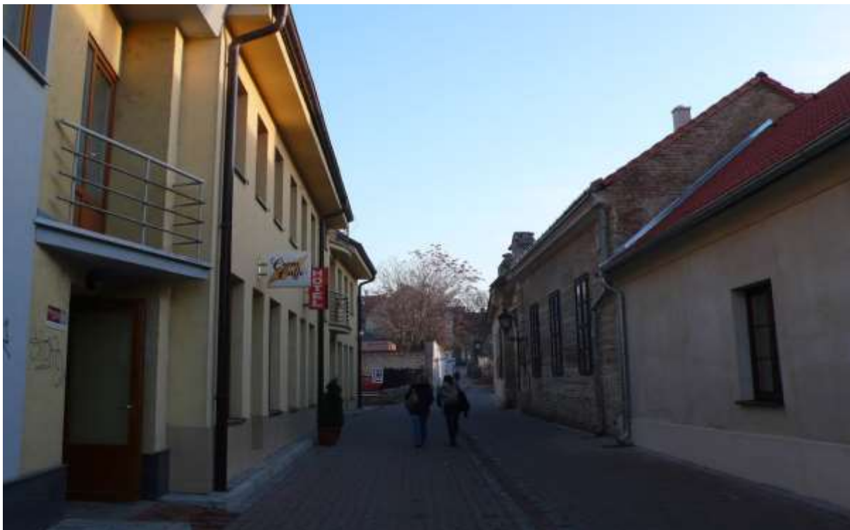
1 - HAU - priehľad východným smerom od Halenárskej ulice na Námestie sv. Mikuláša na sochu Panny Márie