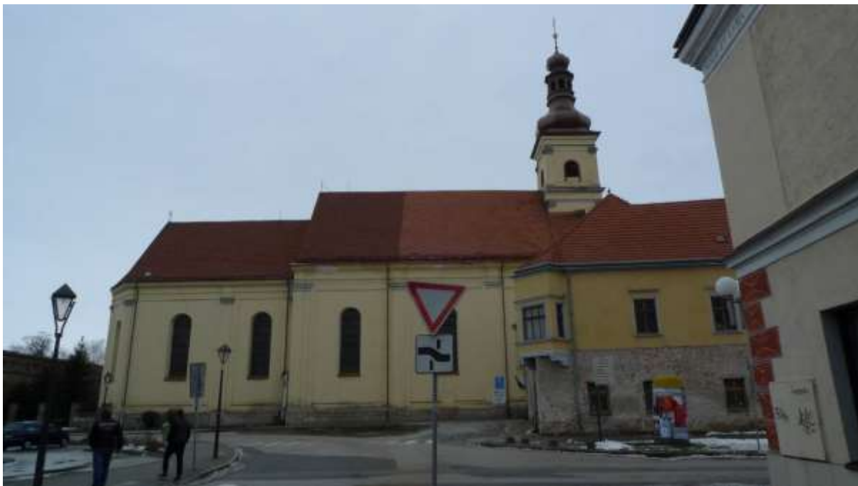
1 - JA - pohľad od Vajanského ulice na Františkánsky kostol a mestské opevnenie