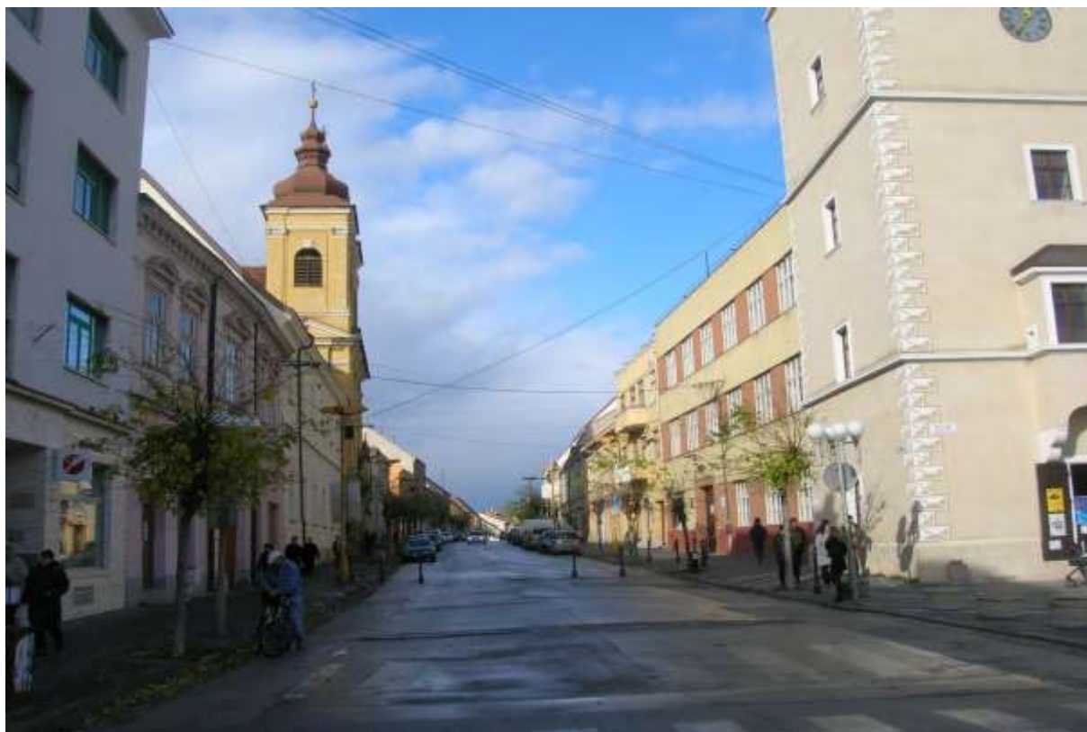
2 - ŠT - priehľad od mestskej veže severným smerom na historickú dominantu veže Jezuitského kostola