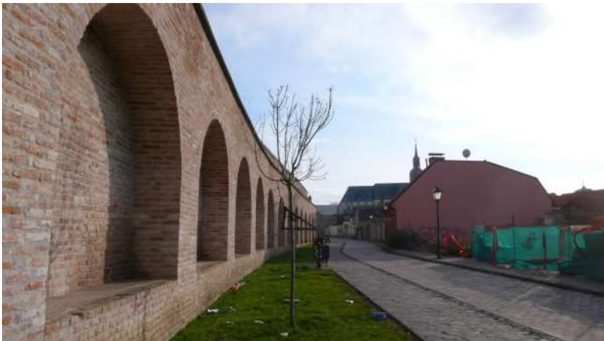
1 - MI - priehľad južným smerom na historické výškové dominanty veže farského kostola sv. Mikuláša