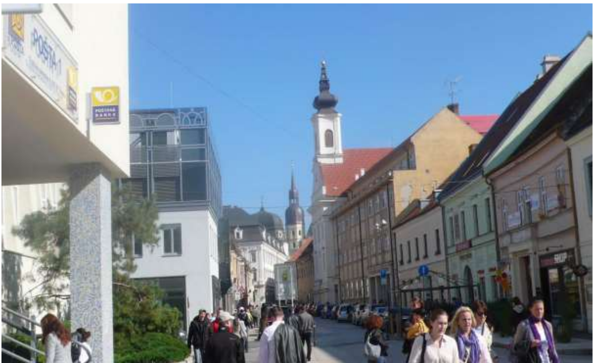
2 - HV - pohľad ulicou východným smerom na historické dominanty veže farského kostola sv. Mikuláša, na vežu Kostola sv. Anny