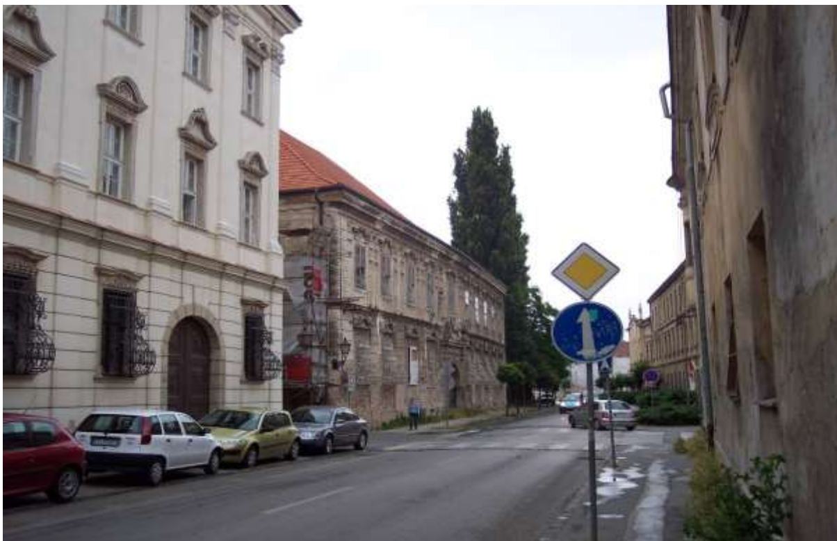
2 – HO - priehľad južným smerom na historickú dominantu univerzitných budov