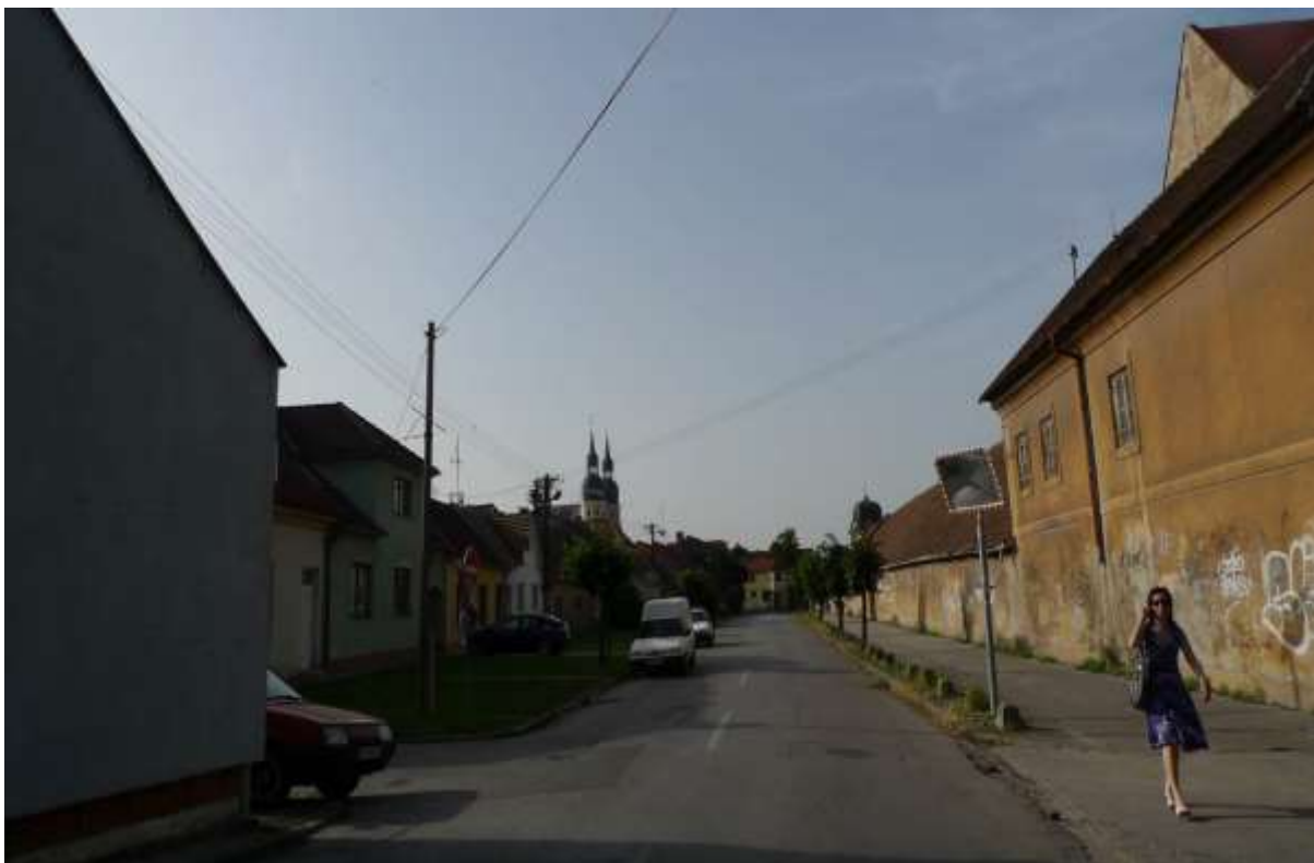
1 - JER - pohľad od Malženickej brány južným smerom na historické dominanty veže farského kostola sv. Mikuláša