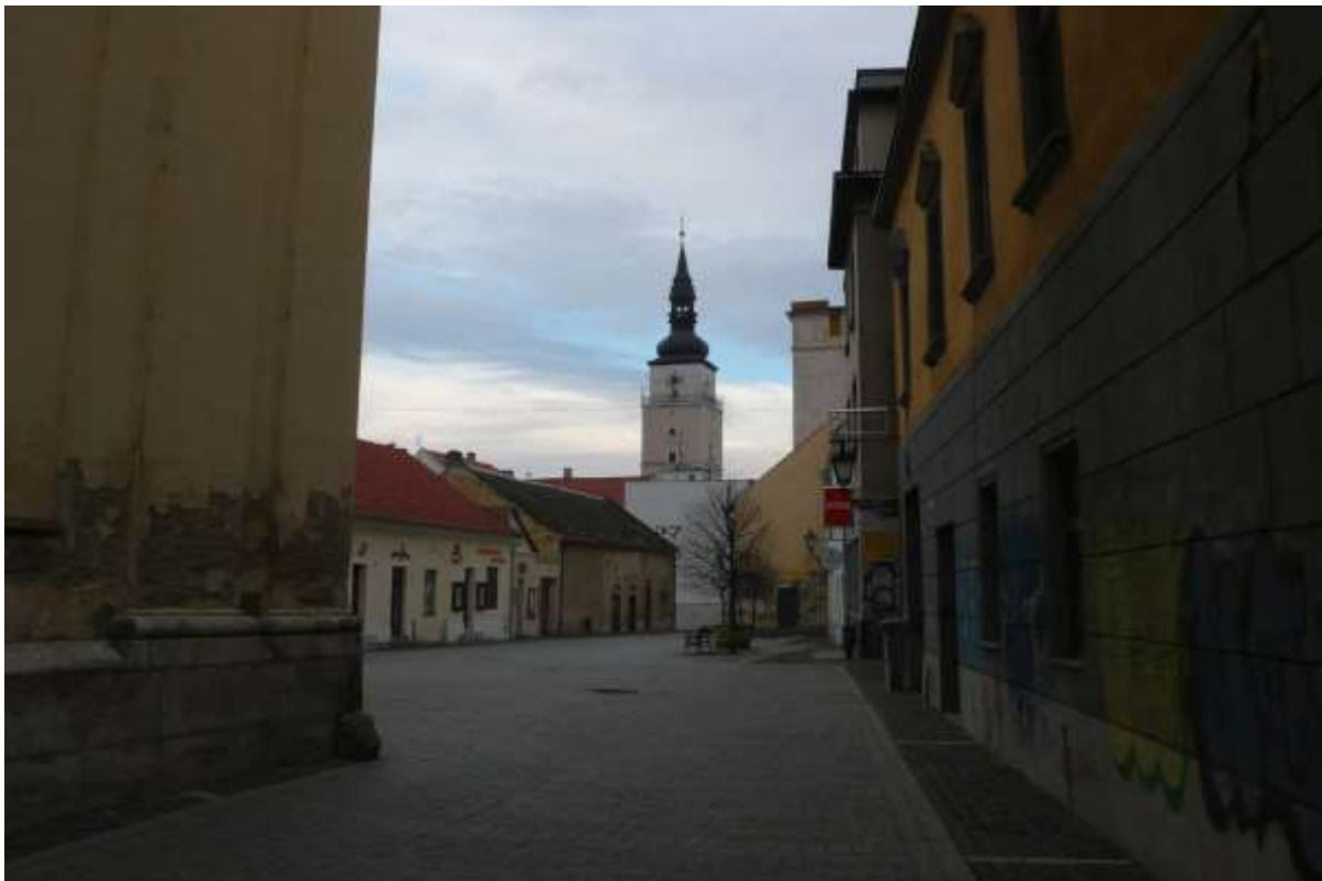
1 - DI - pohľad ulicou východným smerom a priehľad na historickú dominantu mestskú vežu