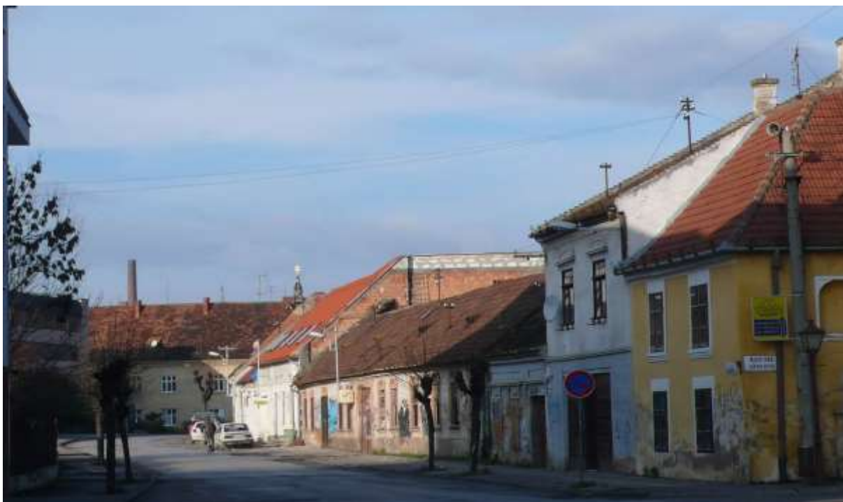
4 - HA - priehľad severným smerom od polyfunkčného objektu pri Dolných Baštách na historickú dominantu mestskú vežu