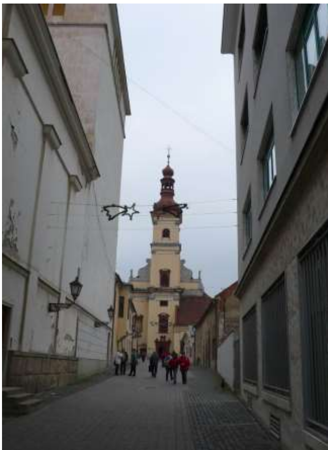
3 - DI - priehľad ulicou západným smerom na historickú dominantu kostola sv. Jakuba - Františkánsky kostol