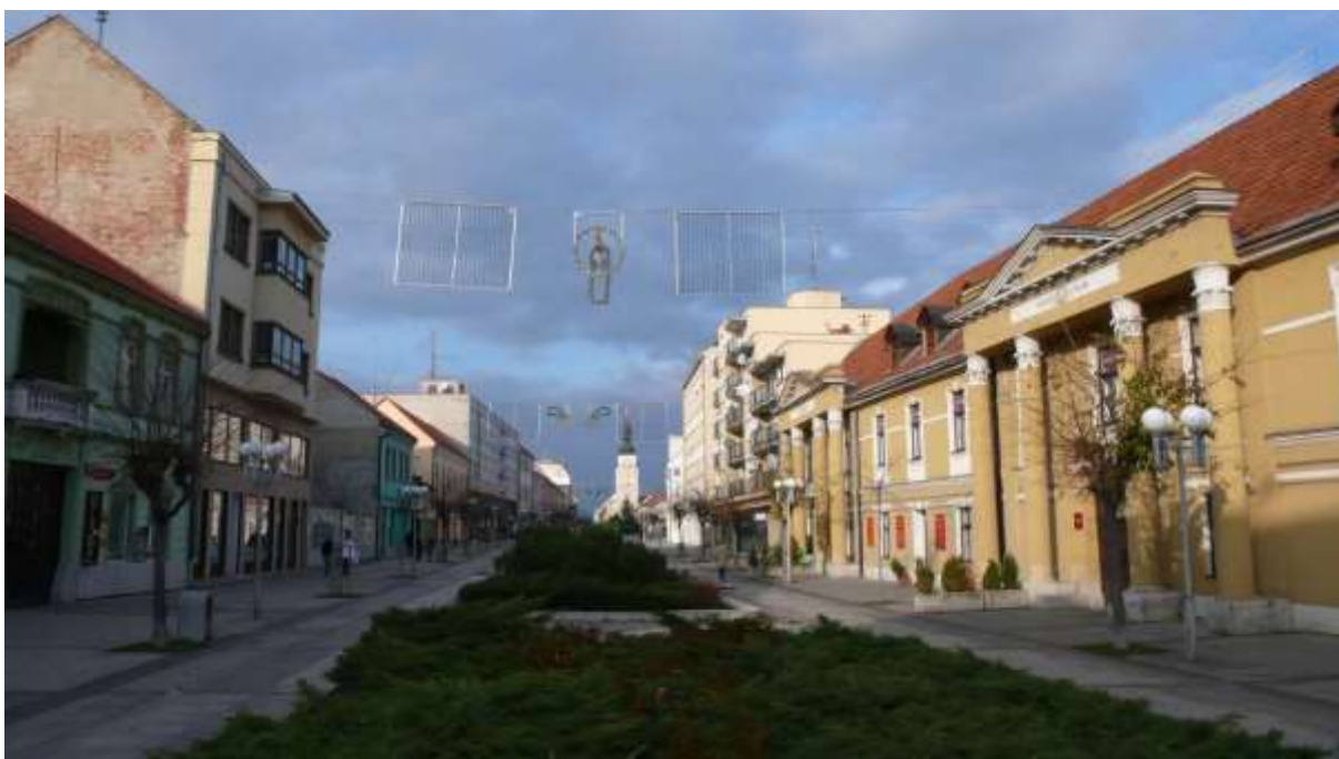
1 - HL - priehľad severným smerom na historickú dominantu – mestskú vežu