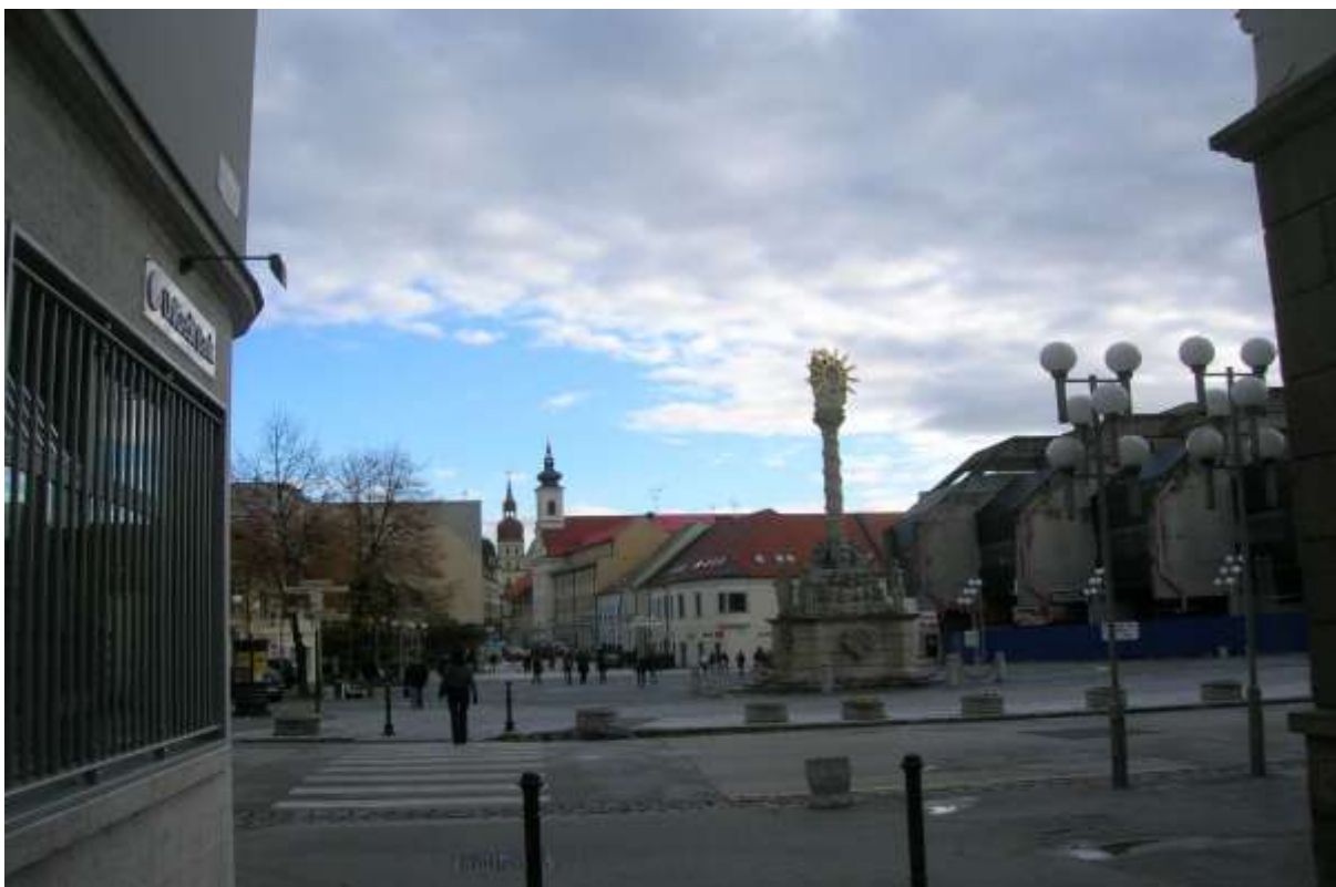
2 - TN - priehľad od Divadelnej ulice východným smerom do Hviezdoslavovej ulice a na historické dominanty veže kostolov sv. Anny a sv. Mikuláša