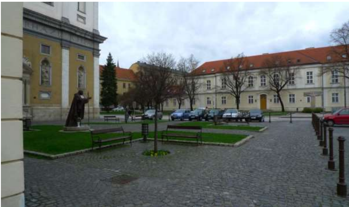
1 - UN - pohľad od Hornopotočnej ulice severovýchodným smerom na Lekársku fakultu - historické dominanty Univerzitných budov a Univerzitného kostola sv. Jána Krstiteľa